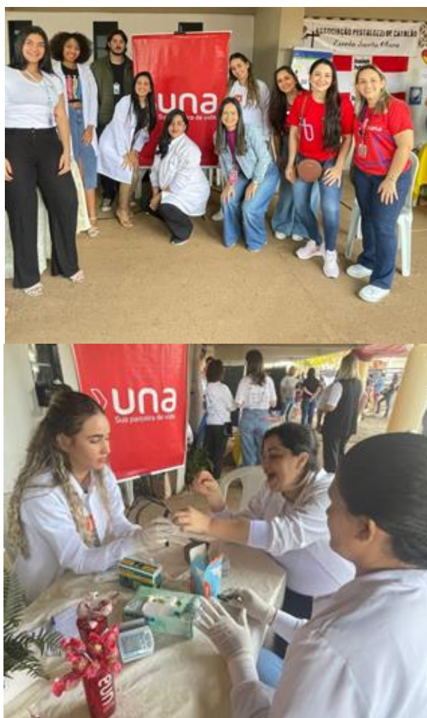
Figura 15 – Participação na II Mostra em Saúde de Catalão

Além disso, o compromisso com a responsabilidade social oferece aos alunos a chance de participar ativamente em ações que promovem a qualidade de vida e o bem-estar da comunidade. O curso de Nutrição, por exemplo, se envolve em diversos eventos, realizando a medição de glicemia e compartilhando informações valiosas sobre hábitos saudáveis com a sociedade. Essas atividades permitem que os estudantes apliquem seus conhecimentos de forma prática, ao mesmo tempo em que fazem a diferença na vida das pessoas ao seu redor.