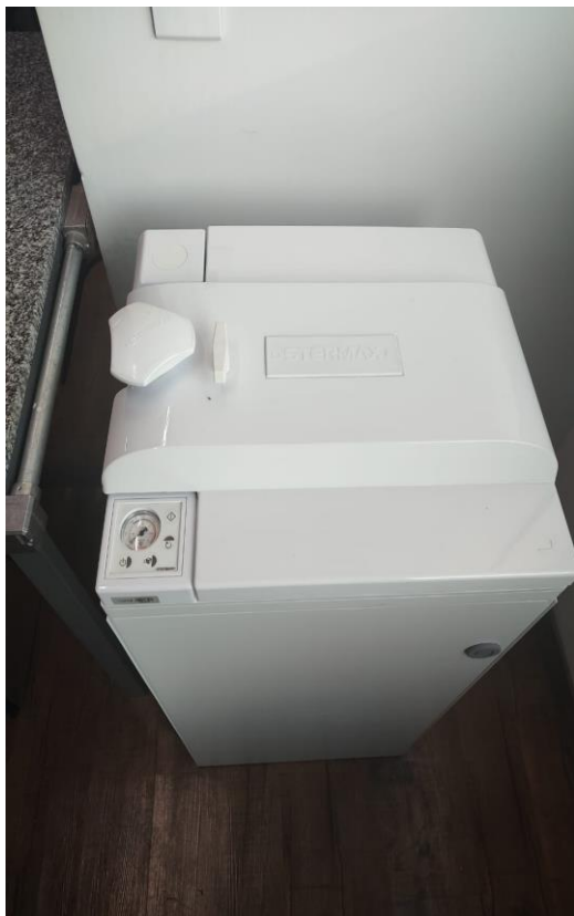
(a) Autoclave Vertical