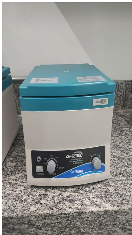
(b) Aparelho Bioplus