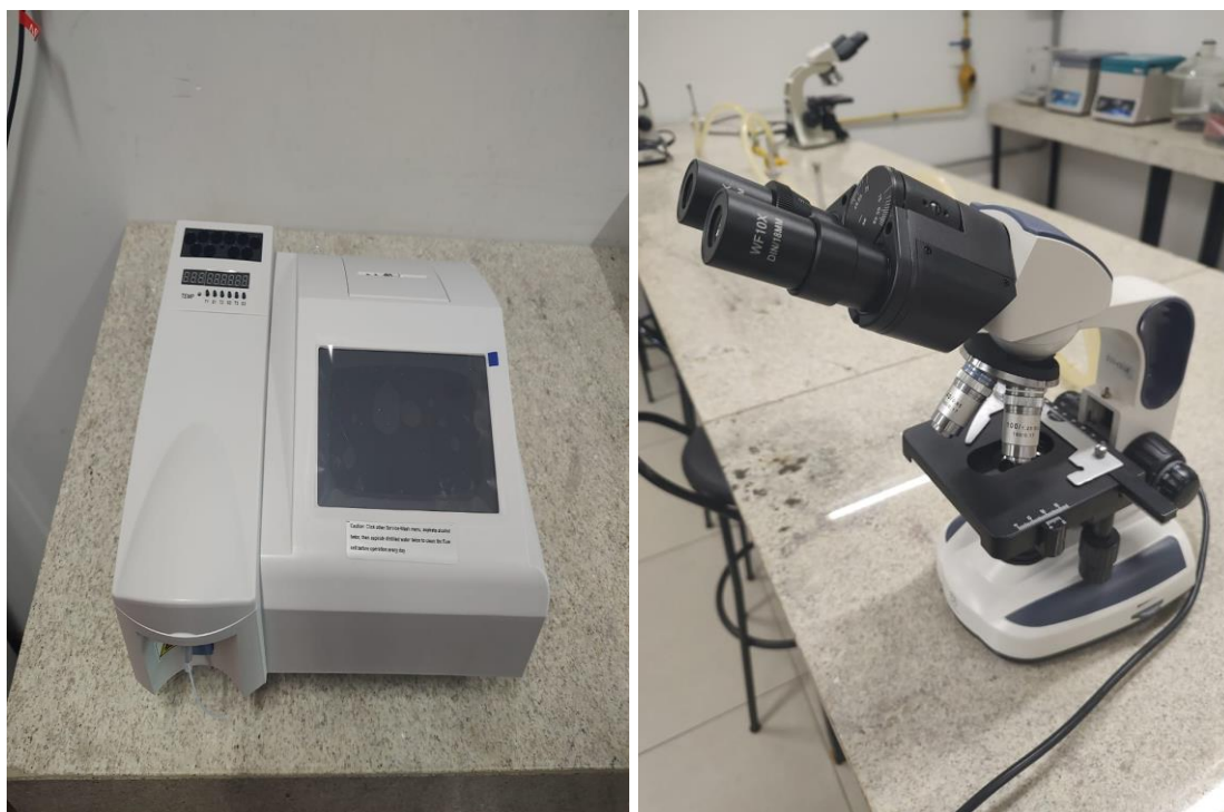
(a) Aparelho bioquímico semiautomático. (b) microscópio ótico

2 – Aquisição de Novos Equipamentos para os laboratórios da saúde: Centrífuga de micro hematócrito, Aparelho Bioplus, Leitora de placas, Autoclave vertical, 15 microscópios novos, Aparelho bioquímico semiautomático.