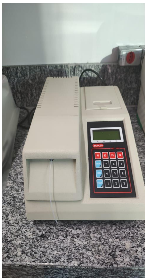
(a) Centrífuga de micro hematócrito