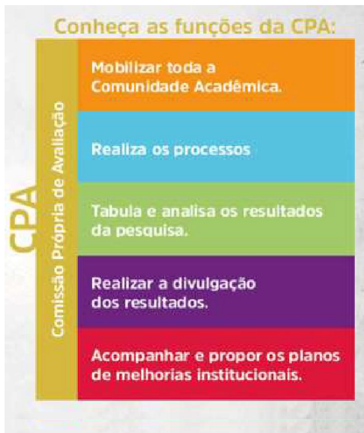
FIGURA 1- FUNÇÕES DA CPA