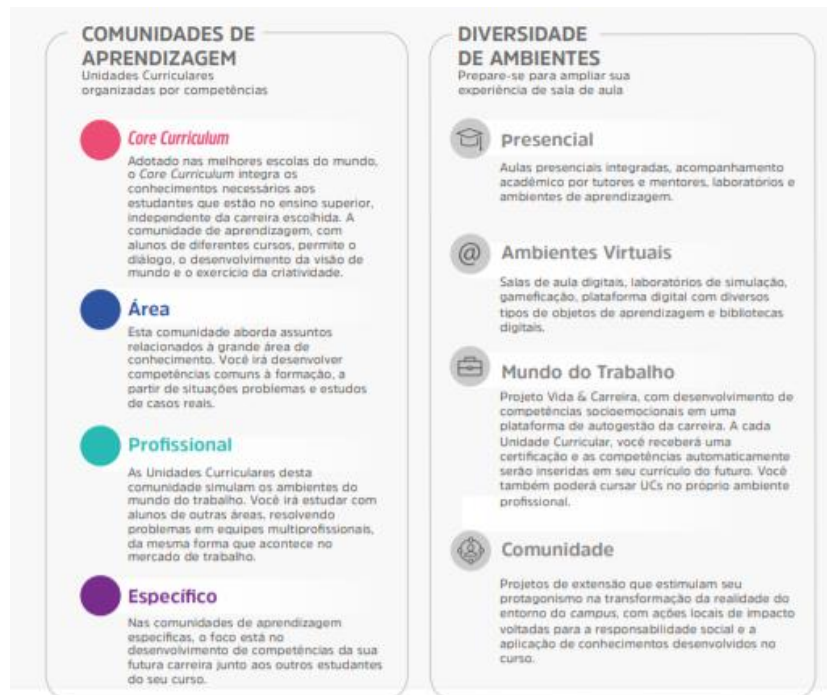
Figura 1 – Comunidades de aprendizagem e diversidade de ambientes

Assim, durante o seu percurso formativo, o estudante desenvolve, de forma flexível e personalizada, conforme perfil do egresso, as competências, conhecimentos, habilidades e atitudes de trabalho em equipe, resolução de problemas, busca de informação, visão integrada e humanizada.