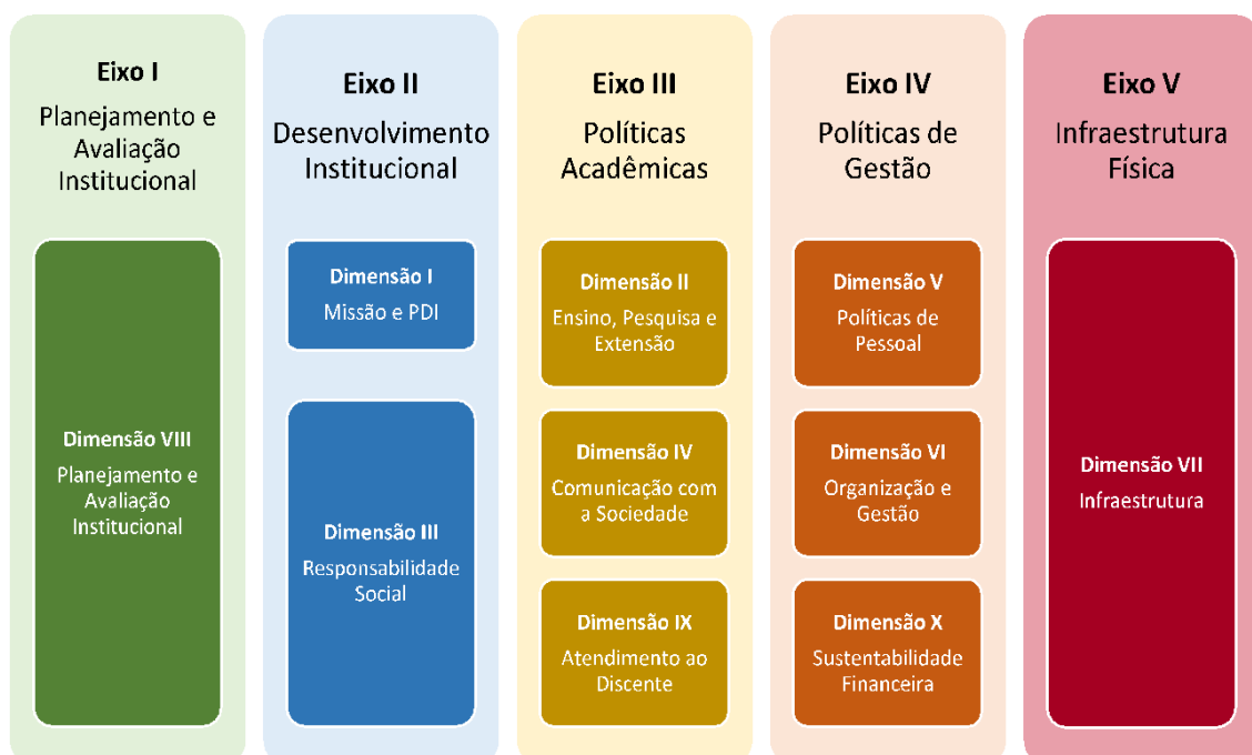
Figura 2 – Eixos e dimensões do SINAES

Essa autoavaliação, realizada em todos os cursos da IES, a cada semestre, de forma quantitativa e qualitativa, atenderá à Lei do Sistema Nacional de Avaliação da Educação Superior (SINAES), nº 10.8601, de 14 de abril de 2004. A legislação irá prever a avaliação de dez dimensões, agrupadas em 5 eixos, conforme ilustra a figura a seguir.