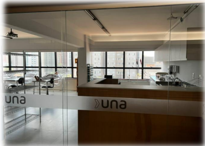
Laboratório de Enfermaria Simulada