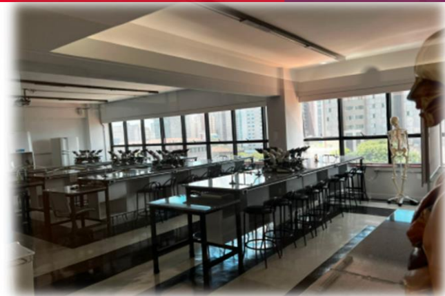
Laboratório de Práticas Integradas