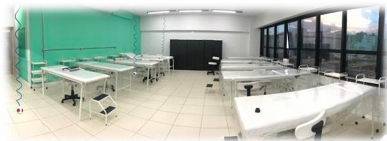
Laboratórios de Macas