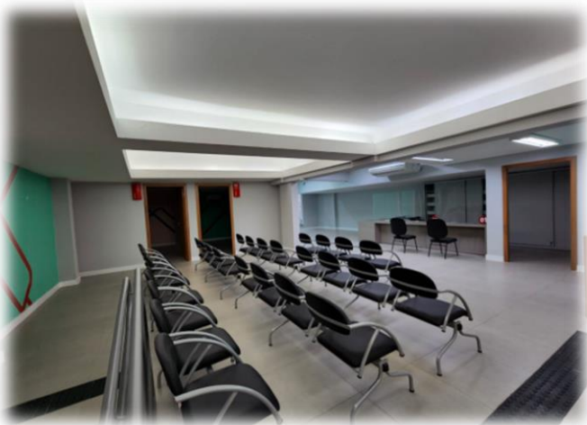
Clínica Integrada da Saúde